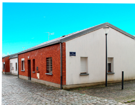
Des logements adaptés, rue Paul Bert