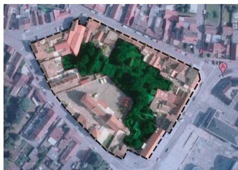
Réaliser un espace partagé entre générations sur l'îlot Jules Ferry,